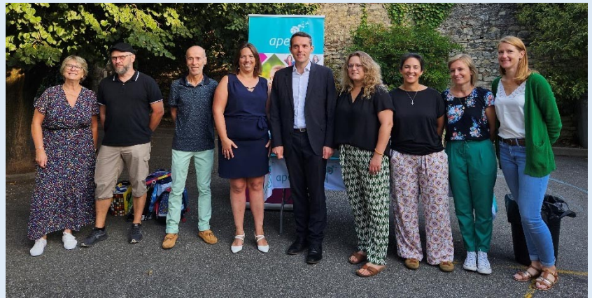
L'APEL a accueilli les familles avec un café convivial.

Merci à monsieur Portier et ses équipes pour leur visite !