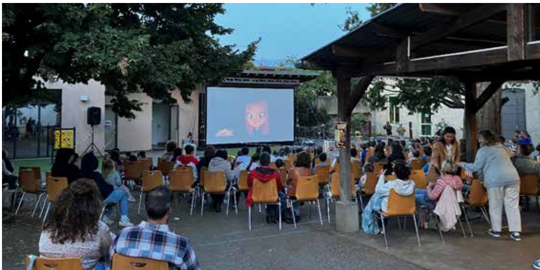
Soirée Portes ouvertes et cinéma plein air, location de matériel financé par l'Apel