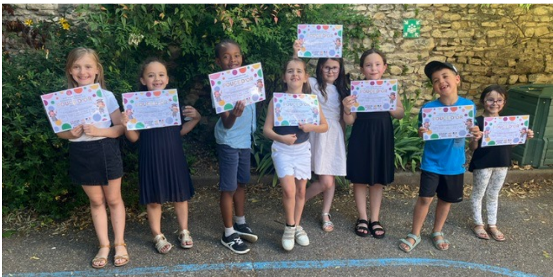
La cérémonie de clôture du club coup de pouce